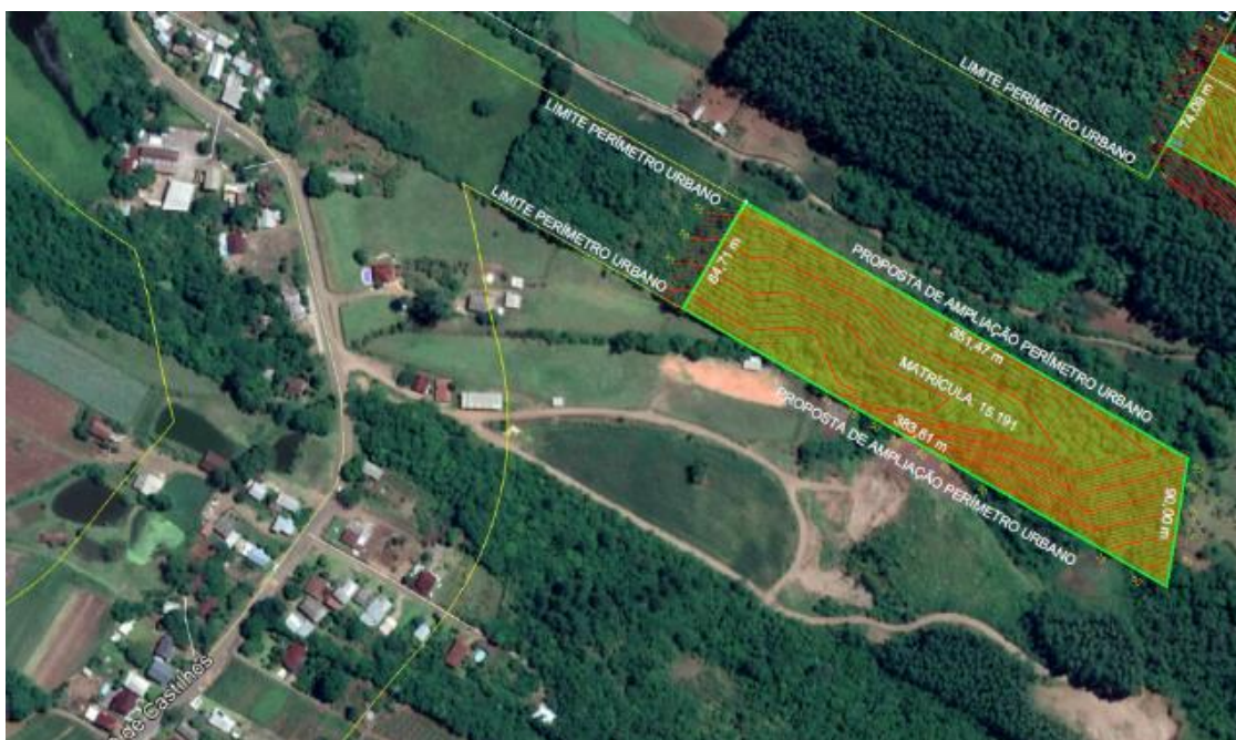
Figure 1 Figura 01 – Detalhe da expansão do perímetro urbano – Matiel/Vale do Lobo

1 - Alteração do mapa do zoneamento, com proposta de expansão da Zona Urbana nos bairros Matiel, Vale do Lobo e Coqueiral: