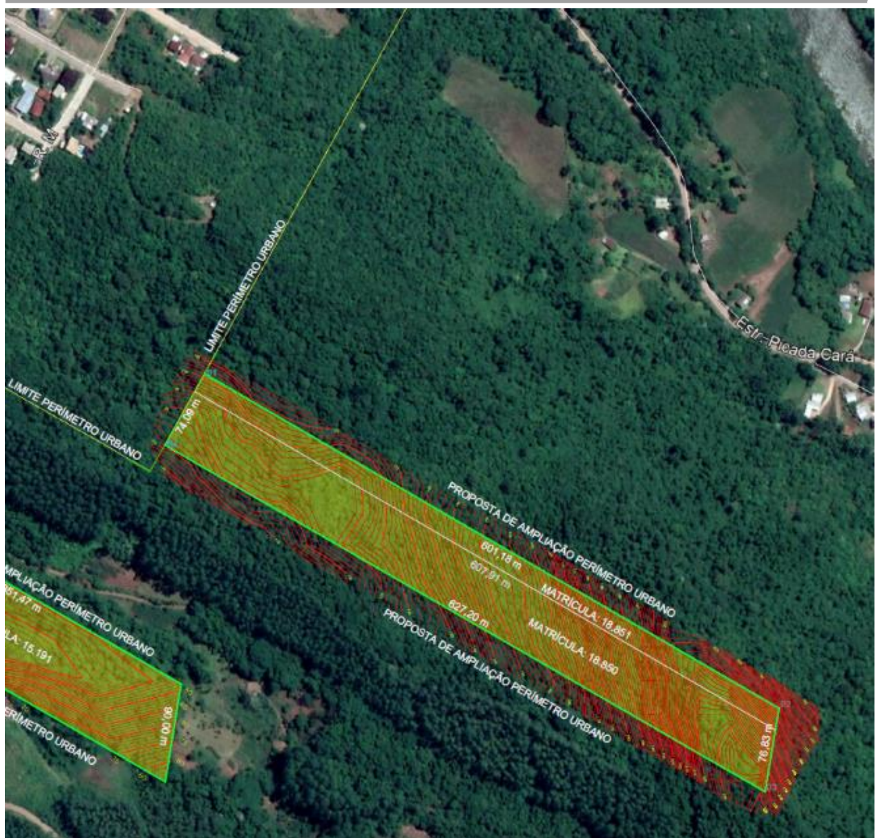
Figure 2 Figura 02 – Detalhe da expansão do perímetro urbano – Matiel/Coqueiral