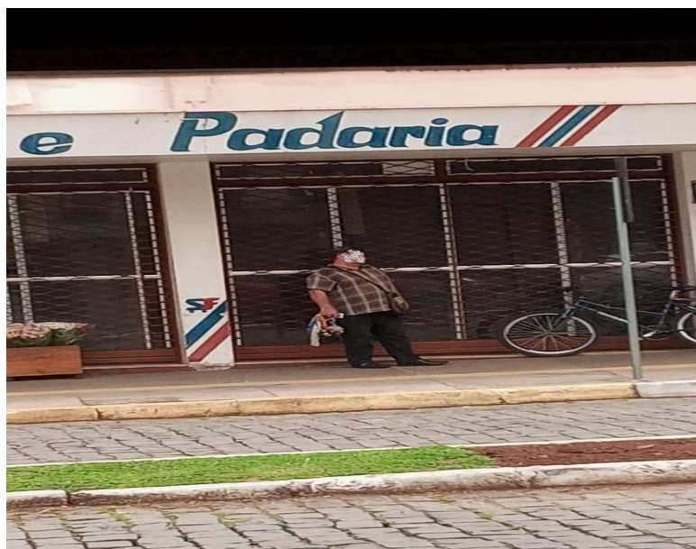
Imagem enviada pelo whatsapp referente à denúncia nº 16