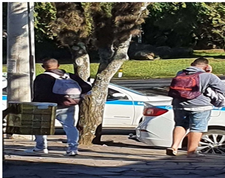
Imagem enviada pelo whatsapp referente à denúncia nº 19