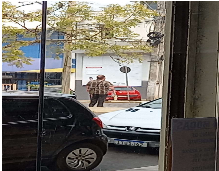
Imagem enviada pelo whatsapp referente à denúncia nº 15